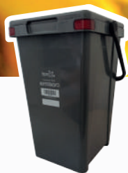
Contenitore grigio RSU indifferenziato

Parte la distribuzione dei nuovi contenitori