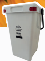
Contenitore bianco Carta e cartone