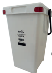
Carta e cartone Contenitore bianco

Da martedì 3 maggio 2022 e fino a sabato 25 giugno 2022 saranno distribuiti i nuovi contenitori per la raccolta porta a porta dei rifiuti: