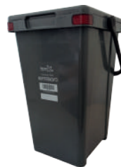
Secco indifferenziato Contenitore grigio

I contenitori, messi a disposizione gratuitamente, saranno muniti di apposito sistema identificativo che consentirà un'analisi puntuale dei conferimenti. Personalizzali, con un'etichetta o un laccetto, così da renderli facilmente riconoscibili ed evitarne lo scambio accidentale durante l'esposizione in strada.